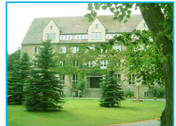
Unsere Schule in Malchow

Eine Finanzierung über BAföG ist möglich. Schulgeld wird nicht erhoben.